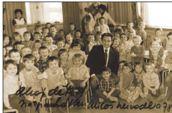
Návštěva Miloše Nesvadby – 1978