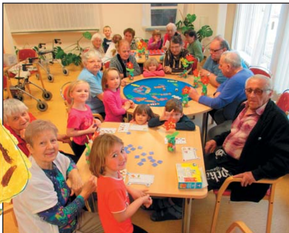
Hrací dopoledne se seniory – duben 2016