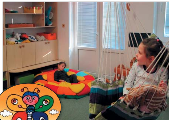
Relaxace ve třídě Motýlci

Výchovně vzdělávací práce s dítětem vychází z jeho důkladného poznání a je založena na principech moderní, zatím málo dostupné aplikované behaviorální analýzy (ABA) a využití jejich technik. Ta pomáhá dětem, kte-