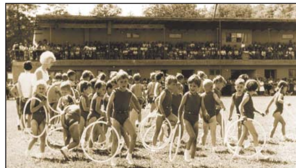
Oblastní spartakiáda ve Slatiňanech – 1970

Výchovná práce, ale i výtvarné soutěže měly vždy přívlastek socialistický. V roce 1970, 1975, 1980, 1985 a 1990 nacvičovaly děti se svými učitelkami na spartakiády.