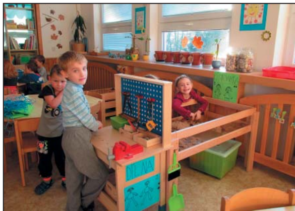
Hry v centrech aktivit

Jak poznáte program Začít spolu? Učitel je podporujícím vzorem, průvodcem i autoritou, tedy osobností, která nemanipuluje, nenarizuje, nepředkládá hotové informace. Třída je uspořádána do hracích koutků, tzv. center aktivit (CA) – např. Šikovní ruce, Pokusy a objevy, Domácnost, Voda, Knihy a písmena, Dílna, Ateliér. CA pomáhají děti přirozeně rozdělit do menších skupinek a nastavit tak podmínky pro pohodovou komunikaci. Děti se