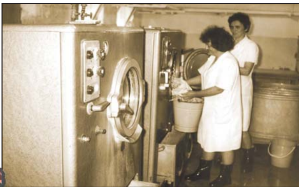
Prádelna – 1982

Do poloviny roku 1995 fungovala v mateřské škole prádelna, která byla umístěna ve sklepních prostorech.