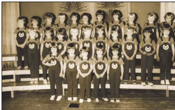
Okresní přehlídka pěveckých sborů ve Skutči – Transportáček – 1986

Rok 1984 přinesl zlepšení vnitřního prostředí. Byl za-