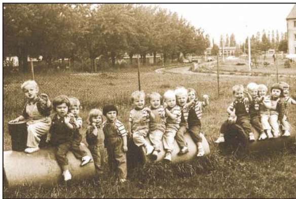
Hra na školní zahradě, na pozadí třešňový sad – 1974

Dne 16. ledna 1967 bylo slavnostně otevřeno a předáno do užívání první společné zařízení v Chrudimi – Jesle a mateřská škola. Do mateřské školy bylo přijato 110 dětí ve věku 3–6 let a do jeslí 45 dětí ve věku 1–3 let. Ovšem děti se staralo 8 učitelek, 7 dětských sester, 5 kuchařek, 4 uklízečky, 3 pradleny a 1 školnice.