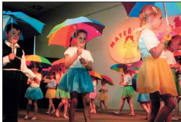
Mateřinka – Duhová vila, Celostátní kolo Nymburk, 2008

Významnou událostí roku 1997 byla oslava 30. výročí založení MŠ. V daném roce proběhlo v Regionálním muzeu první Kacafírkování, předchůdce dnešní Mateřinky, tedy přehlídky mateřských škol. Všechna naše vystoupení v oblastních kolech Mateřinky měla vždy velký úspěch a ohlas ze strany rodičů i pořadatelů. Několikrát jsme reprezentovali náš kraj na celostátním kole v Nymburce.