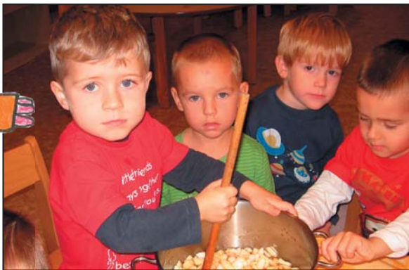
Vaříme jablečný kompot – říjen 2008

Budou nás očkovat proti sardinkám ... (zarděnkám)