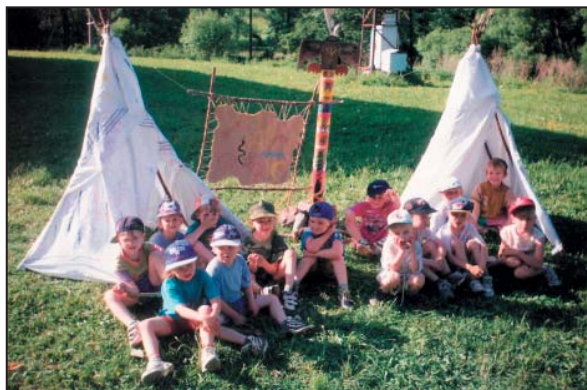
Vrbový tunel – 2016