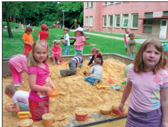
Hry v pískovišti – červen 2010