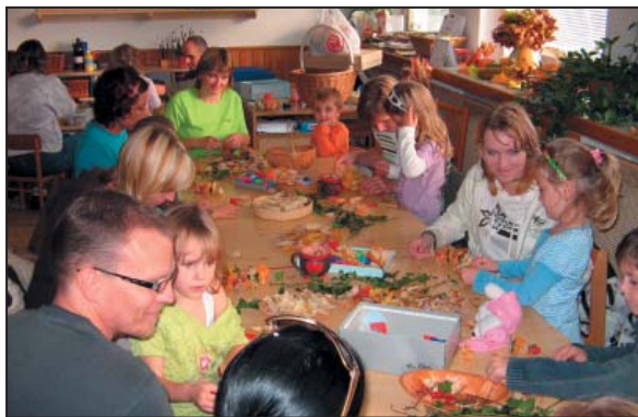
Podzimní den otevřených dveří 2008