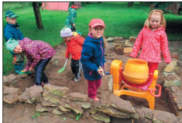
Zednický koutek – 2015

budování relaxační místnosti, tzv. snoezelenu na speciální třídě Motýlci. V roce 2016 si naše webové stránky oblékly nové šaty a my věříme, že se staly nedílnou součástí života rodin našich dětí. Program Začít spolu se rozšířil do všech běžných tříd.