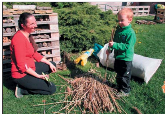
Hmyzí hotel – duben 2016

Byli jsem na výletě na Kuně Hoře ... (Kunětické Hoře)