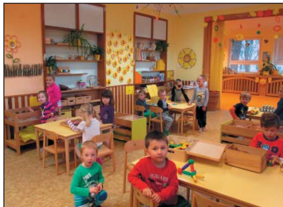
Pohled do běžné třídy

všestranně rozvíjí ve velmi podnětném, ale přehledném a bezpečném prostředí. Způsob práce vede děti k samostatnosti a rozhodnosti, podporuje zvědavost a chuť poznávat nové věci. Rodiče spoluprotvoří vzdělávací program a zapojují se podle svých možností do činností ve třídě.