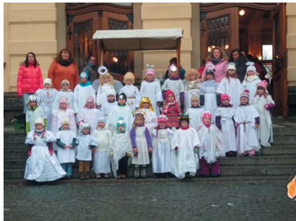
Andělský Tralaláček – 2014

• Transportáček aneb Tralaláček. Pěvecký sbor je nedílnou součástí života naší mateřské školy. První zmínka o jeho činnosti se datuje k roku 1972. Přestože došlo v některých letech k přerušení činnosti a z Transportáčku se stal Tralaláček, původní myšlenka zpívání pro radost se nezměnila. Za 45 let prošly pěveckou výchovou stovky dětí. Zpíváme na benefičních koncertech, na vernisážích výstav, na vánočních jarmarcích, a hlavně u seniorů v různých typech sociálních zařízení.