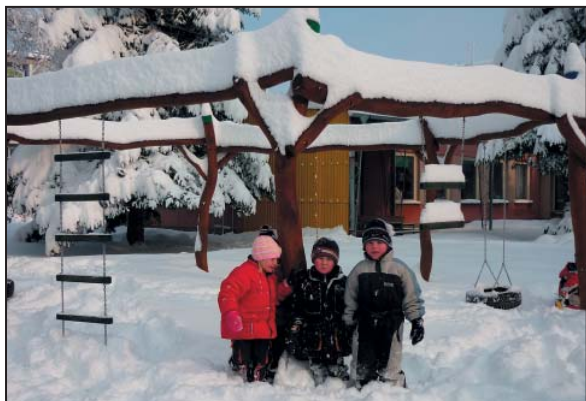
Děti a sníh – leden 2010