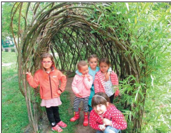
Vrbový tunel – 2016