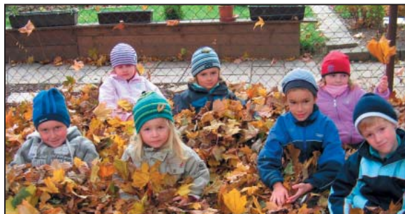
Podzimní hrátky na zahradě – říjen 2010