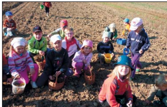
Vybírání brambor – 2010

pomůcky. Na podzim 2007 byla do tělocvičny instalována horolezecká stěna. S koncem školního roku 2007 byly spuštěny první webové stránky a činnost školky se dostala do širšího povědomí veřejnosti.