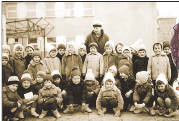
Předškoláci – 1968–1969

V prvním roce z mateřské školy odešlo 35 dětí do Základní devítileté školy. První měsíce provozu školky potvrdily, že zařízení splnilo očekávání a běh na dlouhou dobu započal.