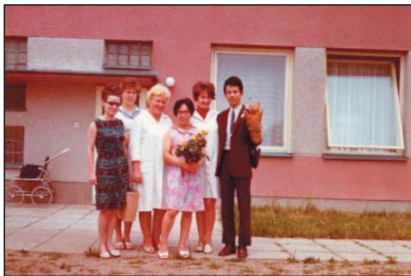
Japonská delegace – červen 1968

v naší socialistické republice. Zhotovili mnoho snímků, natočili i krátký film. Film byl vyslán japonskou televizí, vyšel článek v japonských novinách“.